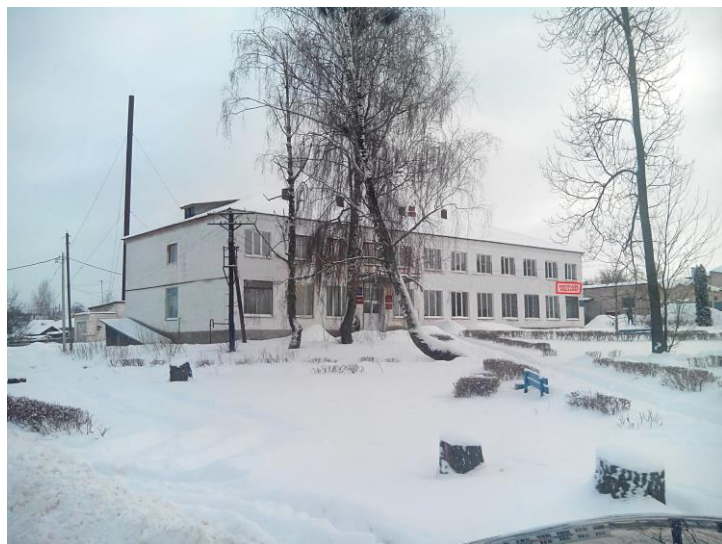
ФОТОГРАФИЯ сторона А (по ходу движения)