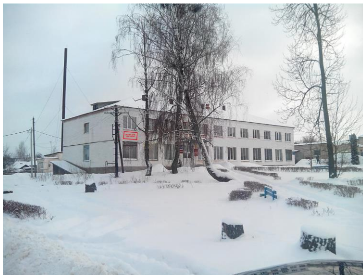
ФОТОГРАФИЯ сторона А (по ходу движения)