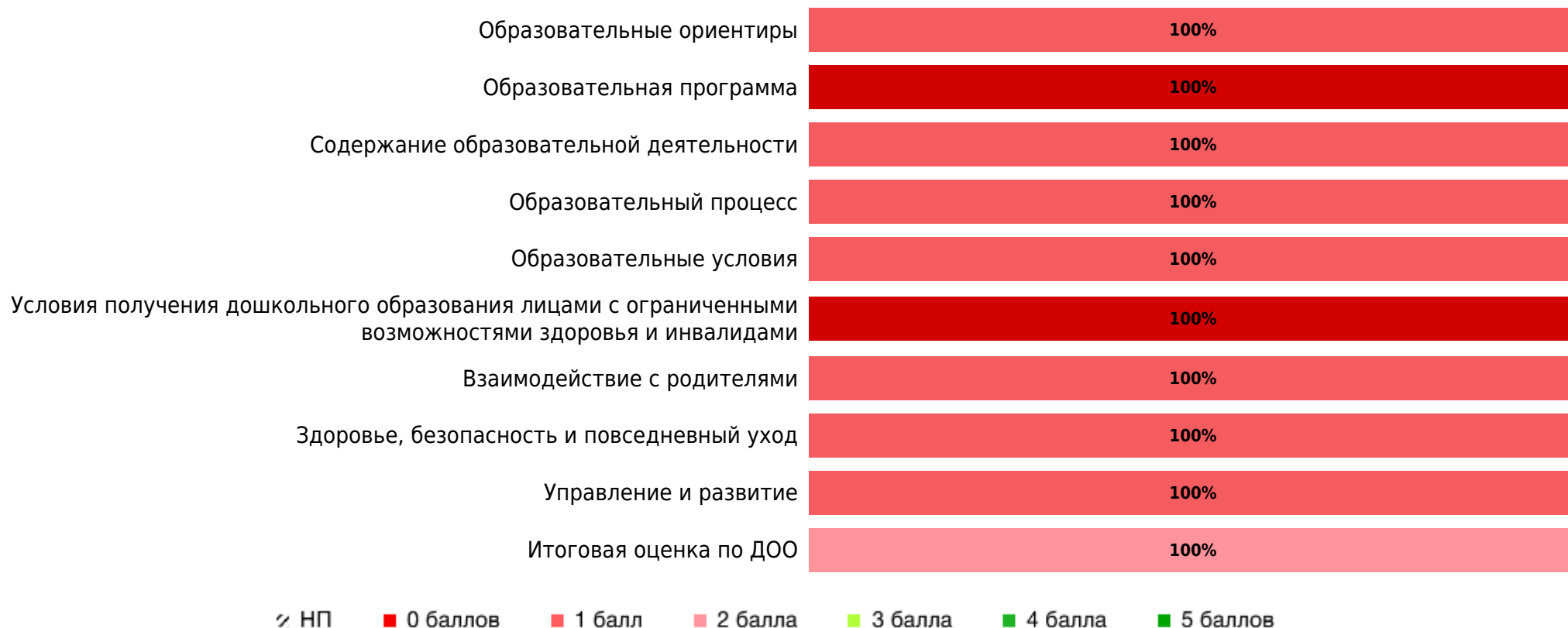
Доли ДОО с разными баллами у педагогов