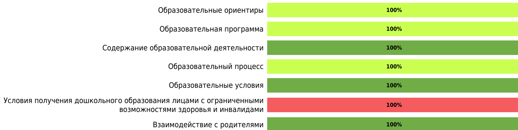
Доли ДОО с разными баллами (степень вовлеченности родителей)

Результаты оценки качества образования в ДОО субъекта РФ с точки зрения родителей/законных представителей (степень вовлеченности) по областям качества (по 5-балльной шкале):